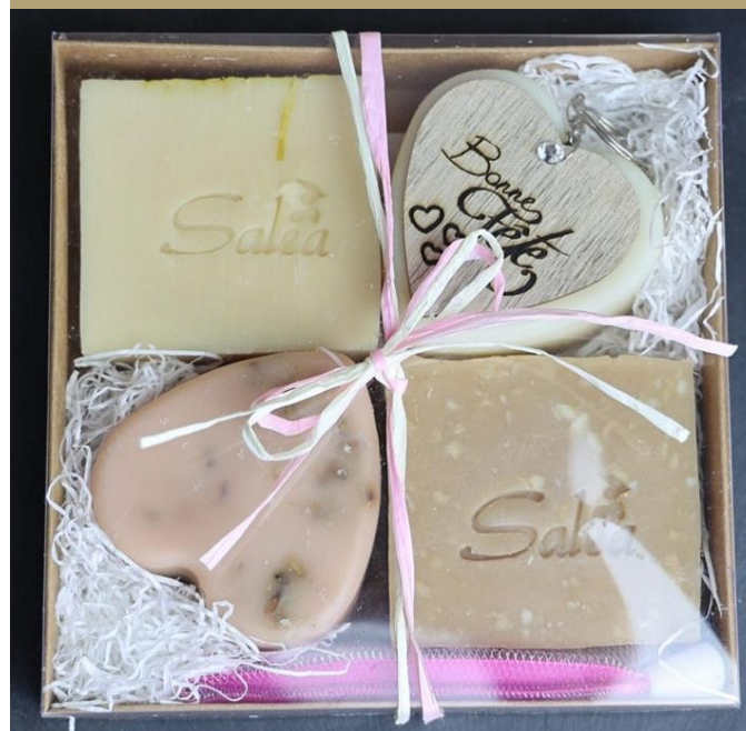
3. Pack medium 25€