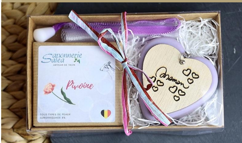
2. Duo de savons 13€