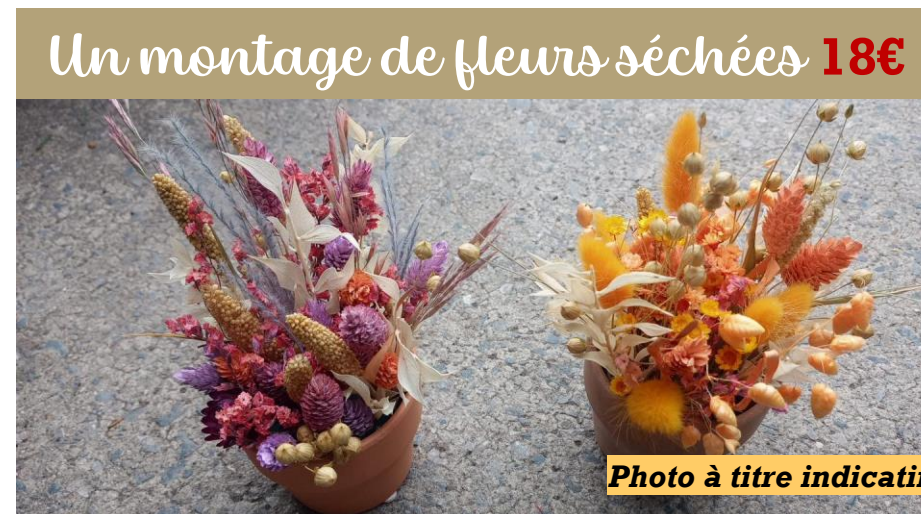
Un montage de fleurs séchées 18€