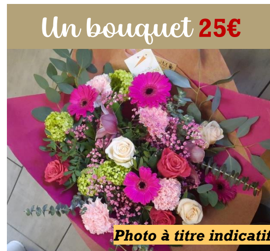
Un bouquet 25€

Elle a ouvert deux magasins, Elianthus à Lobbès et Floral'm à Mont-sur-Marchienne , et emploie 3 employés fleuriste . Si vous passez à Lobbès, vous verrez certainement sa belle-mère qui l'aide beaucoup au magasin.