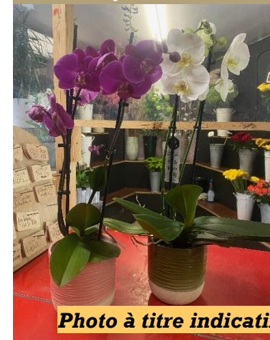
Une orchidée en pot 25€